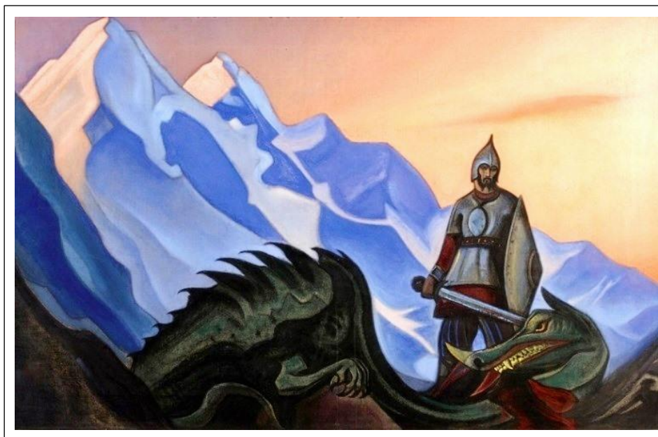
Н.К. Рерих. Победа. 1943.

Всё то, что не нравится в себе и подлежит изживанию, порождено когда-то и где-то нами самими волею нашей и выбором свободным. Потому в процессе преодоления в себе негодных накоплений можно применять формулу «я тебя породил, я тебя и убью», и силы в ней найти, и поразить собственное порождение своего желания и своей воли. Последнее решение воли сильнее предыдущего. И если человек что-то породил в прошлом сам, своей волей, то сам же властью своей может он уничтожить своё порождение. Быть во власти своих порождений - самое последнее дело. И превосходство духа над ними возможно всегда утвердить, если осознано, что иного выхода нет. (Гр.13-364).