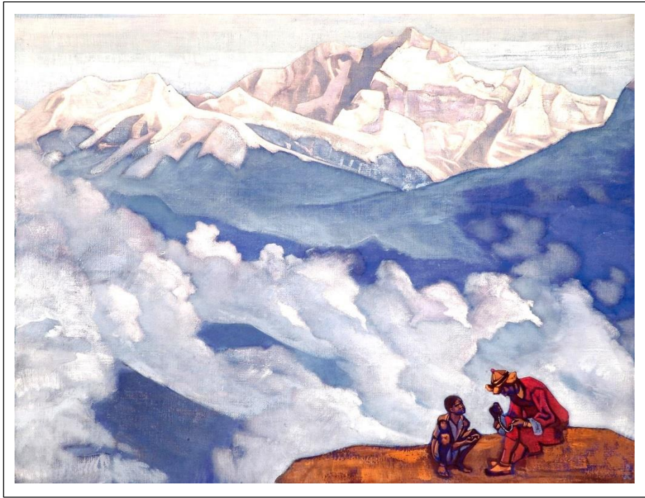
Н.К. Рерих. Жемчуг исканий. 1924. (Музей Николая Рериха, Нью-Йорк)